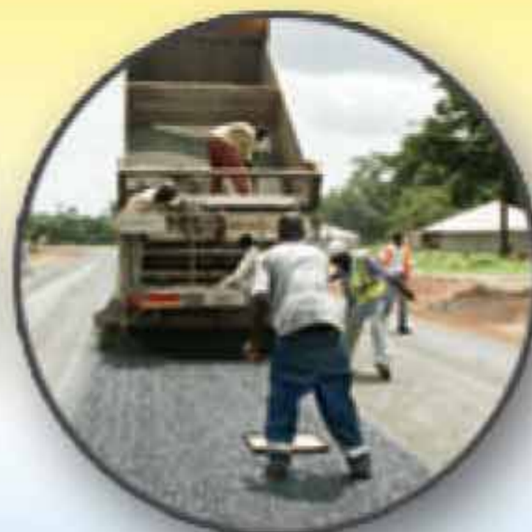
Aménagement de chaussées