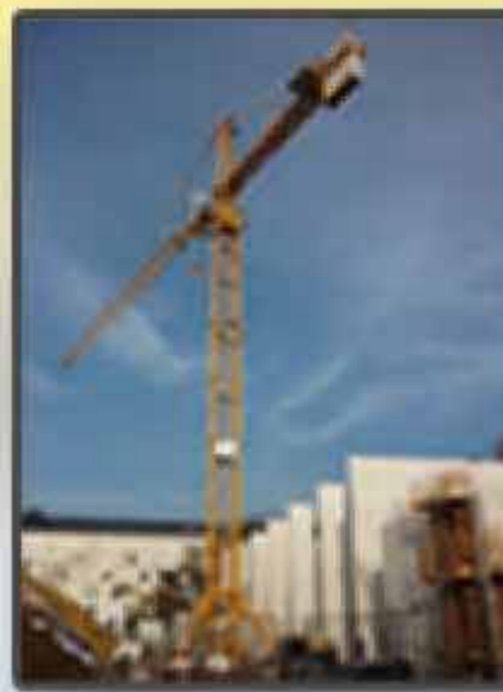
Grue & Bétonnière de chantier